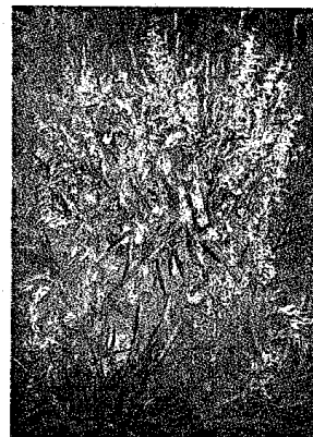
A.Uzielos paveiksluose, tapytuose Vengrijoje, atsirado daugiau laisvės ir ryškių spalvų.

atranką", - pasakoja autorius, kuris tapo pirmuoju Baltijos kraštų menininku, surengusiu šioje galerijoje parodą.